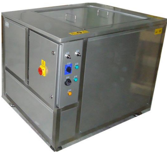
Bac ultrasons à partir de 20 % dans l'eau