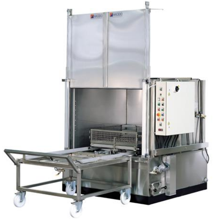
Machine de lavage par aspersion à partir de 20 % dans l'eau