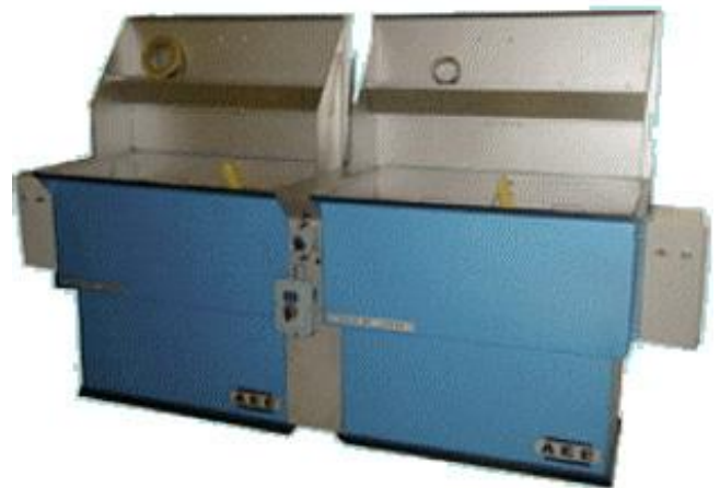
Bacs pour immersion à froid ou à chaud à partir de 50 % dans l'eau