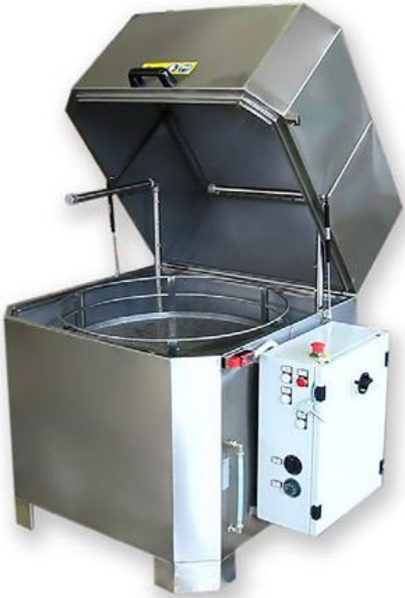
Panier à rotation ou en translation