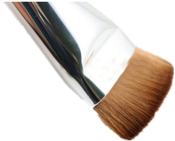
Dégraissage avec brosse

code article 514931 fiche de données de sécurité 108212