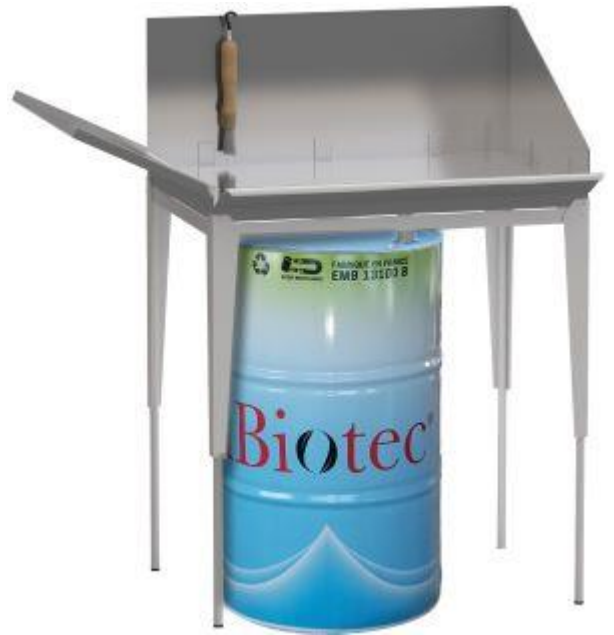
Fontaines à solvants à partir de 50 % dans l'eau