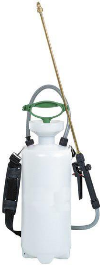
Pulvérisateurs basse pression avec rinçage à l'eau à partir de 20 % dans l'eau